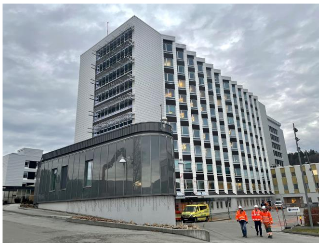
Helse Møre og Romsdal HF Ålesund sykehus Poliklinikk for mage-tarm-sjukdommar 6026 Ålesund

Du kan få refundert reiseutgiftene dine om du fyller vilkåra for reiserefusjon. Sjå nærare informasjon og evt. elektronisk registrering av reise på www.helsenorge.no .